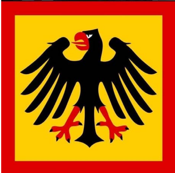
Steinmeier und Steinlein - Neue Herren im Bundespräsidialamt

Beispielloser Eklat in Deutschlands Bundespräsidialamt : Der Personalrat tritt zurück, nachdem der neue Präsident Steinmeier und sein Amtsleiter Steinlein im Handstreich - ohne Ausschreibung und gegen die Mibestimmungsregeln - zahlreiche hochdotierte Amtsposten mit ihren Gefolgsleuten und Parteigenossen besetzt haben.